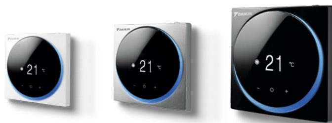
Weiß RAL 9003 (glossy)

Der Madoka Raumregler ist in drei attraktiven Farben erhältlich und verleiht jedem Raum Stil und Klasse. Mit nur 85 x 85 mm ist der Raumregler extrem kompakt. Madoka kombiniert Raffinesse mit Einfachheit. Dank dem intuitiven Touchscreen wird das Display vergrößert und die Bedienung erleichtert. Und die Madoka Assistant App vereinfacht die erweiterten Einstellungen, wie Zeitplan oder Sollwertbegrenzung. Dazu kann Ihr Smartphone problemlos über Bluetooth® mit dem Madoka Raumregler verbunden werden.